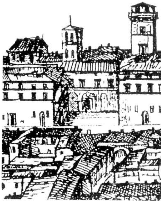
29. Rom, S. Agnese in Agone. Ausschnitt aus Tempestas Romplan von 1593

In die Substruktionen der Zuschauertribüne an der westlichen Seite der domitianischen Kampfbahn war seit früher Zeit eine Kirche zu Ehren der hl. Agnes eingebaut, die an diesem Ort eine Station ihres Martyriums erlitten haben soll. Erstmals als Kirche erwähnt ist diese Stätte im Codex von Einsiedeln. Eine Weihinschrift unter Calixt II. aus dem Jahr 1123 belegt eine Renovierung im ersten Viertel des 12. Jahrhunderts. 2 Veränderungen und Erneuerungen sind danach erst für das späte 16. und frühe 17. Jahrhundert bezeugt, als die Kirche den Chierici Regolari Minori übergeben wurde. 3 1652 begannen die Arbeiten für Neu S. Agnese, zunächst nach den Plänen Girolamo und Carlo Rainaldi. 4 Dabei wurden die antiken „fornices“ abgetragen und die mittelalterliche Kirche fast völlig zerstört. Der Neubau ist um ein beträchtliches Stück nach Osten verschoben. Nur die mutmaßliche Stätte des Martyriums und ein kleiner Teil des ehemaligen nördlichen Seitenschiffs sind als kryptenartige Anlage (Abb. 32) unter der Nordostecke der Kirche erhalten. 5