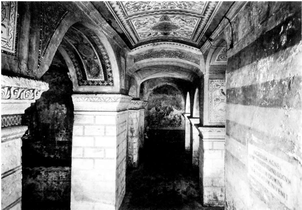
32. Rom, S. Agnese in Agone. Blick in die heutige Unterkirche

Westen auf Straßenniveau eine Kapelle eingerichtet worden und eine neu systematisierte Treppe führte hinab in den Kirchenraum. Dieser war inzwischen (gegen 1600) umorientiert worden. Durch zarte Linien sind drei Altäre am Westende angedeutet. Ein Zugang erfolgte nun und offenbar auch schon zu Ugonios Zeit von der Piazza Navona aus. Im Westen war der bescheidene Kirchenraum durch einen Korridor noch zusätzlich verkleinert worden. Die Aufmessung lässt erkennen, dass sich die Grundfläche des mittelalterlichen Kirchenraumes – ohne Eingangsbereich und ohne sacellum – einem Quadrat von 13 m Seitenlänge annähert. 11 Eine Bauaufnahme des Sacellum und eine Rekonstruktion als dreischiffige Kirche versuchte Rohault de Fleury. 12