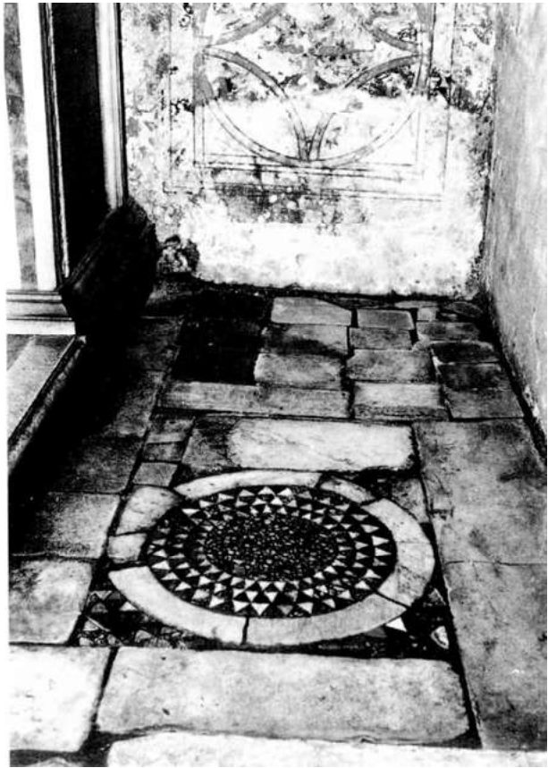
34. Rom, S. Agnese in Agone. Pavimentdetail in der heutigen Unterkirche

Von der mittelalterlichen Marmorausstattung sind in der heutigen Unterkirche (Abb. 32) nur drei Rechteckfelder des Paviments (Abb. 33, 34) erhalten, die von Dorothy Glass mit der Erneuerung von 1123 in Verbindung gebracht werden. 17 Sie sind typisch für die teppichhafte Pavimentierung eines Seitenschiffs im 12. Jahrhundert und können deshalb – trotz einiger Störungen – als originaler Rest des mittelalterlichen Baus gelten. Außerdem sind an der tiefsten Stelle, dem Ort des Martyriums, restaurierte Reste eines frühchristlichen Mosaikbodens erhalten. Kennzeichnend ist eine Blüte im Quadrat, deren Zentrum eine Steinscheibe (Rota) bildet. 18