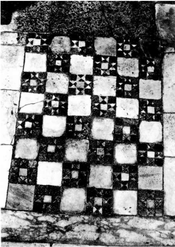
33. Rom, S. Agnese in Agone. Pavimentdetail in der heutigen Unterkirche